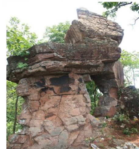
ผาประตูเมือง